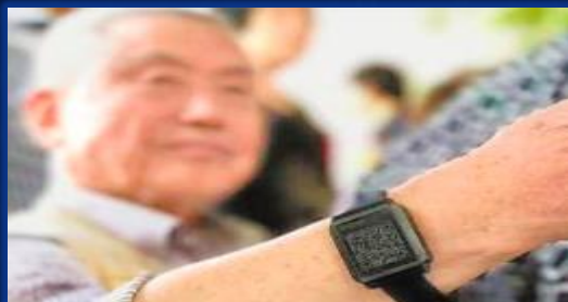
社区老人健康手环