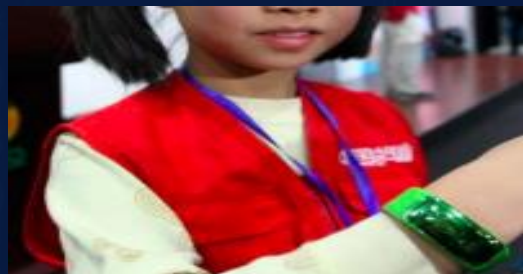
社区幼小定位手环